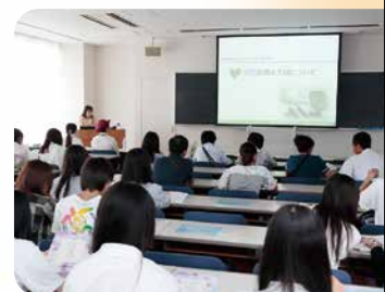
自己表現文説明会