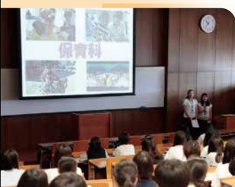
先輩からのメッセージ

※オープンキャンパスの開催日時・プログラムは変更になる場合があります。 参加前にホームページでご確認ください。