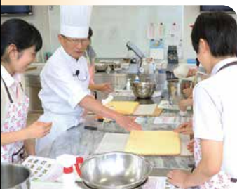
学びの楽しさ! 体験講座 (食物栄養科(パティシエコース))