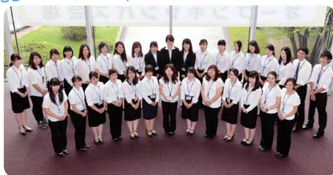
オープンキャンパスでは、在学生(☆山スタ☆)が受付やキャンパス 見学ツアーのガイドとしてみなさんをご案内します。