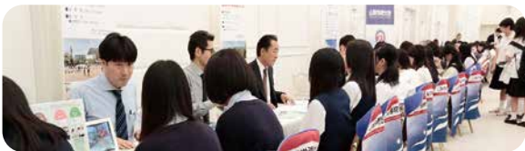
※進学相談会の最新情報は、ホームページ等で確認してください。