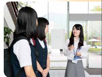
キャンパス見学ツアー