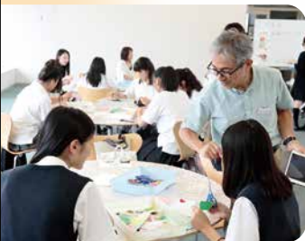
学びの楽しさ! 体験講座 (保育科)