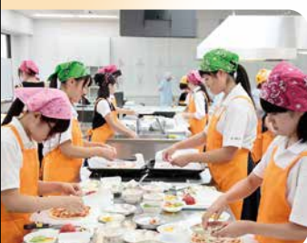
学びの楽しさ! 体験講座 (食物栄養科(栄養士コース))