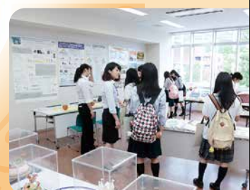
資料展示(食物栄養科)