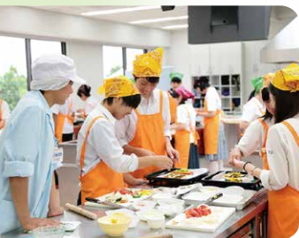
学びの楽しさ! 体験講座 (食物栄養科(栄養士コース))