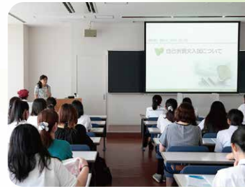
自己表現文説明会

オープンキャンパスでは、在学生(☆山スタ☆)が受付やキャンパス見学ツアーのガイドとしてみなさんをご案内します。