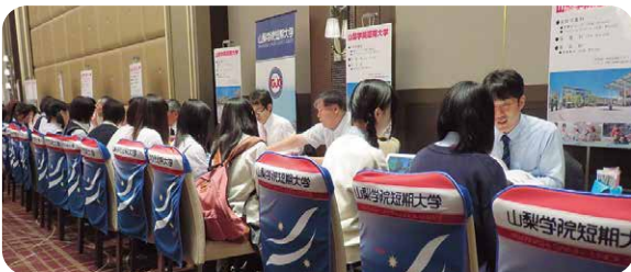
※進学相談会の最新情報は、ホームページ等で確認してください。