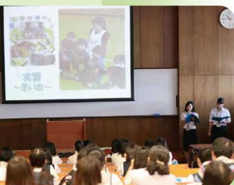
先輩からのメッセージ

※2017年4月、フードクリエイティブコースを「パティシエコース」に名称変更予定。 ※オープンキャンパスの開催日時・プログラムは変更になる場合があります。 参加前にホームページでご確認ください。