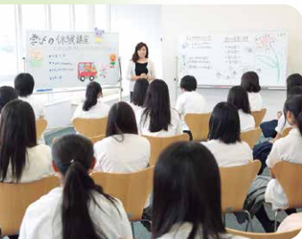
学びの楽しさ! 体験講座 (保育科)