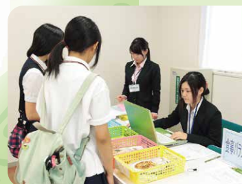
資料展示(食物栄養科)