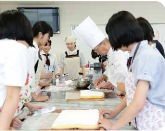
学びの楽しさ! 体験講座 (食物栄養科(パティシエコース))

オープンキャンパスでは、在学生(☆山スタ☆)が受付やキャンパス見学ツアーのガイドとしてみなさんをご案内します。