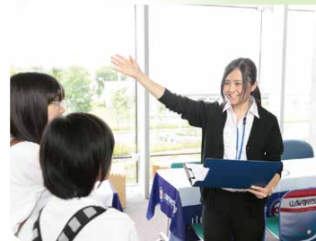
キャンパス見学ツアー